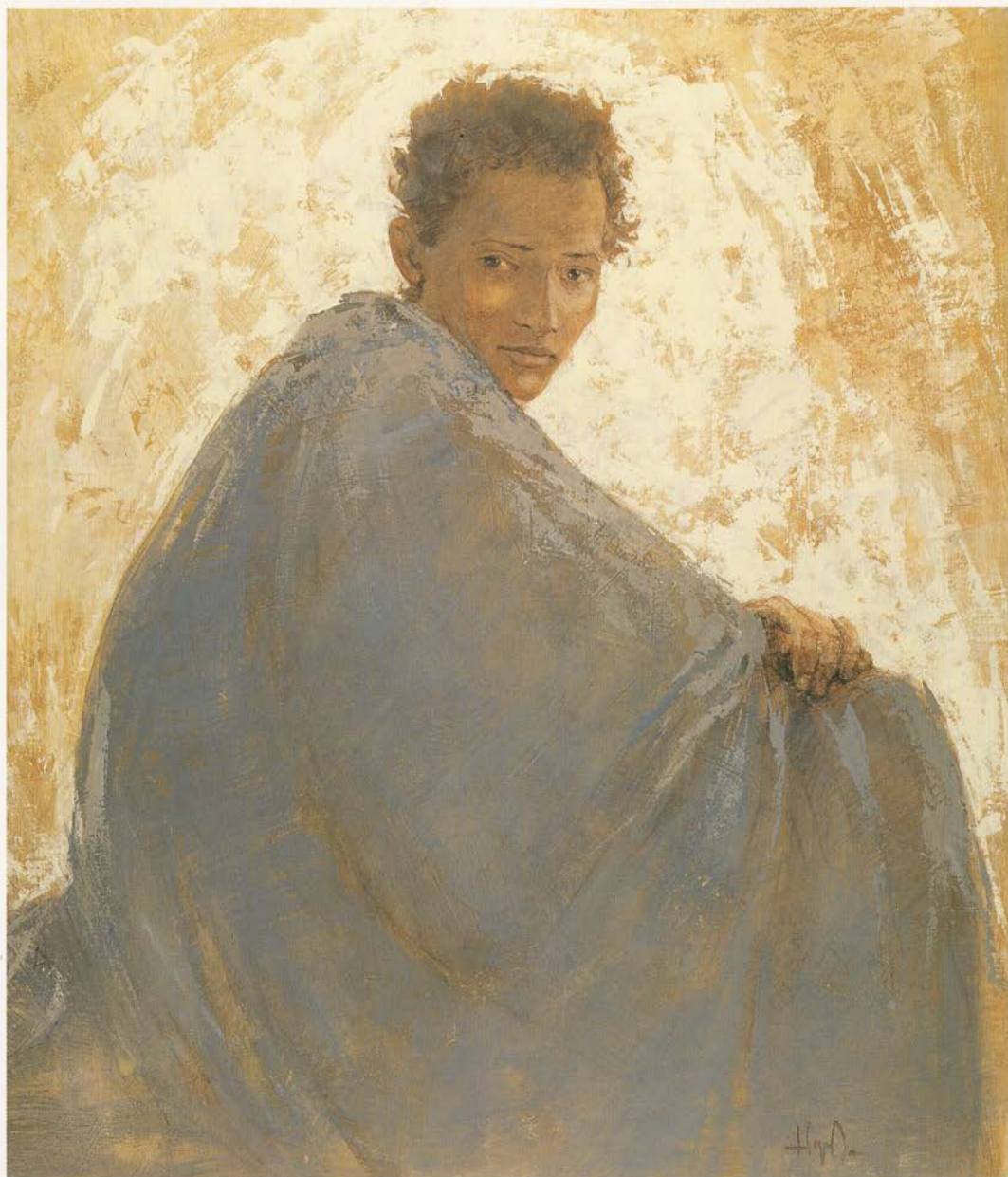
"Joven Tuareg" Técnica mixta sobre lienzo. 83 x 71,5 cms.