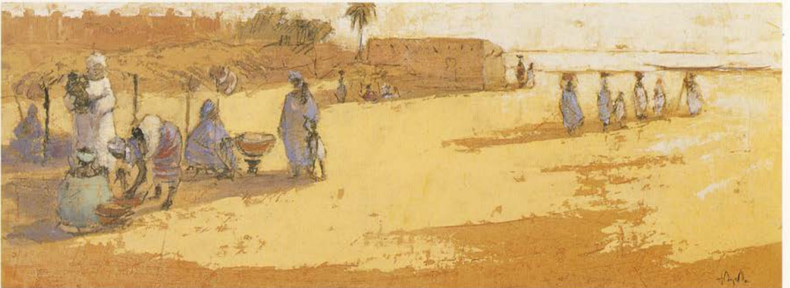
"Día de mercado" Tecnica mixta sobre tabla 60 x 22 cms.