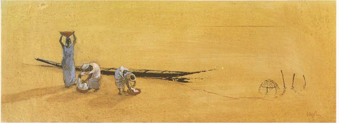
"Rio Niger" Tecnica mixta sobre tabla 60 x 22 cms.