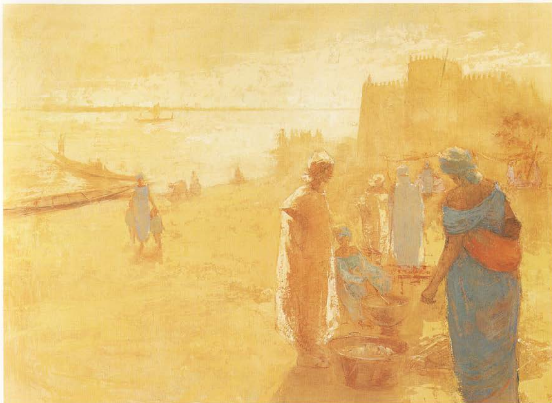
“La gran Mezquita” Técnica mixta sobre lienzo. 120 x 87 cms.