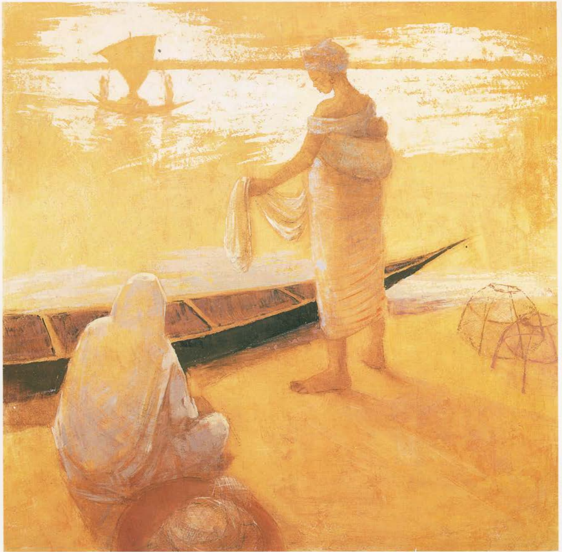
“I ni sogoma” Técnica mixta sobre lienzo. 122 x 122 cms.